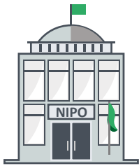
Uffici Nazionali di PI (NIPO)

Prima di presentare una domanda internazionale, il richiedente deve possedere un marchio commerciale nazionale esistente (o una domanda di marchio commerciale) nell'ufficio di proprietà intellettuale di uno dei territori del Sistema di Madrid (il marchio di base).